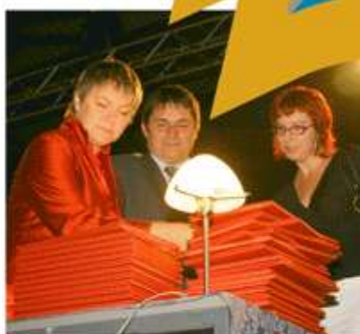
Le petit rouge: alkimija. Znanje je naša strast, čeprav je ogenj medtem postal elektrika.