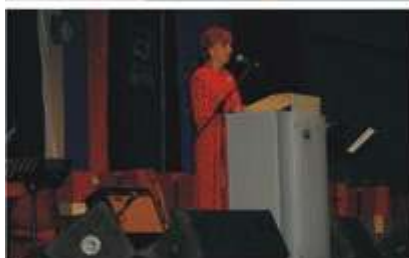
Besede za na pot: viharji bodo, zajeli boste veter v jadra in mu dali smer.