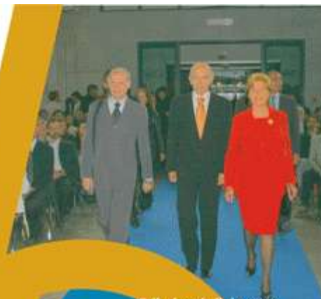
Prihod gostitelja in gostov